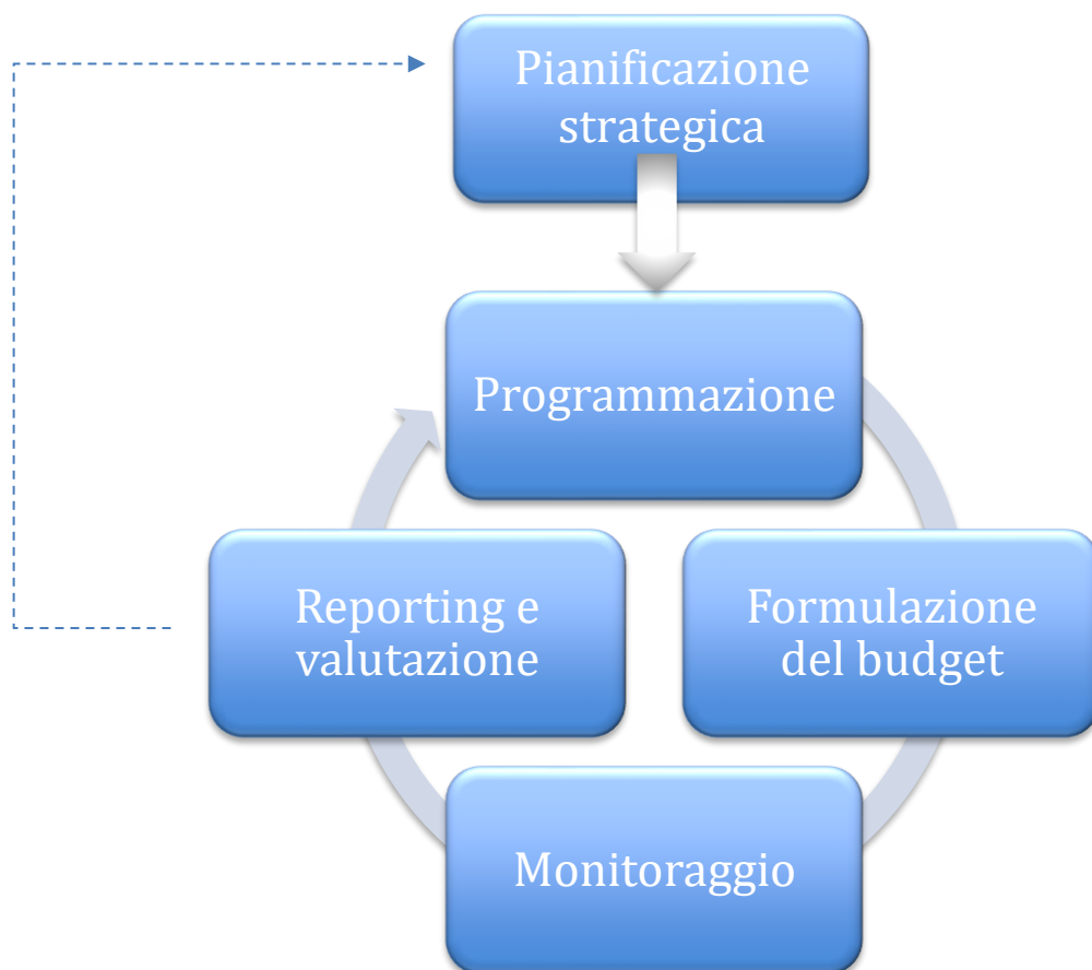
Fig. 1 Il ciclo della performance

A sua volta, il Piano integrato è il primo tassello del ciclo della performance, che vede tre fasi fondamentali: